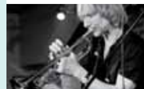
Figure dominante du Nu jazz, le quartet du trompettiste franco-suisse Érik Truffaz réussit l'exploit de plaire à la fois aux connaisseurs de jazz et aux amateurs de musique urbaine. La trompette feutrée de Truffaz, accompagnée de rythmes qui groove, teintés d'électro, d'accents hip-hop et de sonorités du monde, crée des

ambiances musicales absolument envoûtantes. Artiste prolifique, Érik Truffaz parcourt le globe depuis longtemps pour s'imprégner des musicalités du monde. Avec ses fidèles compagnons de route, il débarque pour partager avec nous le fruit de leurs rencontres. Soyez du voyage pour une incursion musicale dans l'univers de ce nomade.